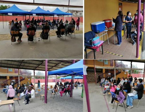
Jueves 21 y viernes 22 de octubre