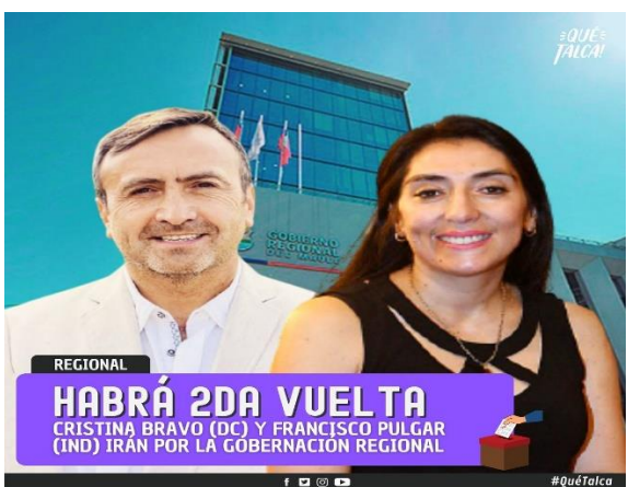
Los dos candidatos a Gobernadores que van a segunda vuelta.