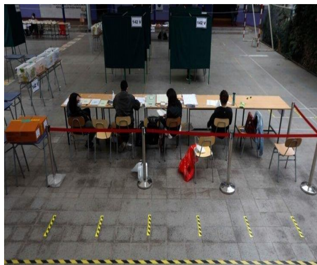
Baja participación de jóvenes se destaca en las jornadas de votación.