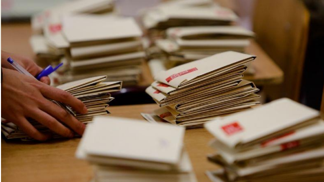
Conteo de votos

ESTA EDICIÓN ESTA DEDICADA A LA FORMACIÓN CIUDADANA