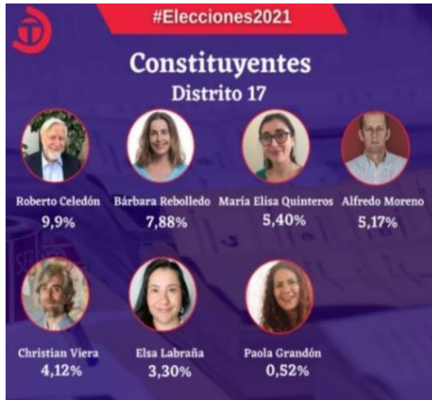
7 constituyentes elegidos por Talca

Quedamos atentos a la segunda vuelta de Gobernadores para tener claridad de quien nos representará como comuna y región y velará por nuestras necesidades y brindará apoyo a quienes más lo necesitan.