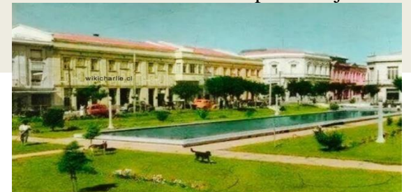
Foto de la Plaza Cienfuegos, Ex Escuela Concentradas de damas y varones.

Este miércoles 12 de mayo del año 2021, Talca, “la ciudad del trueno” cumplió 279 años de vida, fecha que no todos los talquinos recuerdan o tienen grabadas en su memoria, como lo es el aniversario de la ciudad que los vio crecer y que hoy los cobija. La ciudad antiguamente se dividía en dos barrios: el alto y el bajo. El primero era desde la alameda hacia el norte y el segundo desde el primer punto hacia el sur. Además de las casas, que estaban en un solar o en medio solar, estaban las casas de las autoridades, la casa del cabildo, la cárcel y la iglesia. Las calles tomaron nombres de iglesias y familias, destacándose socialmente las familias Donoso, Silva, Opazo y Vergara. Un pequeño paseo por la historia de los inicios de nuestro querido Talca. Si sabes algún otro dato, coméntalo en tu clase de Historia con la Profesora Jessica o en tu clase de orientación con tu profesor jefe.