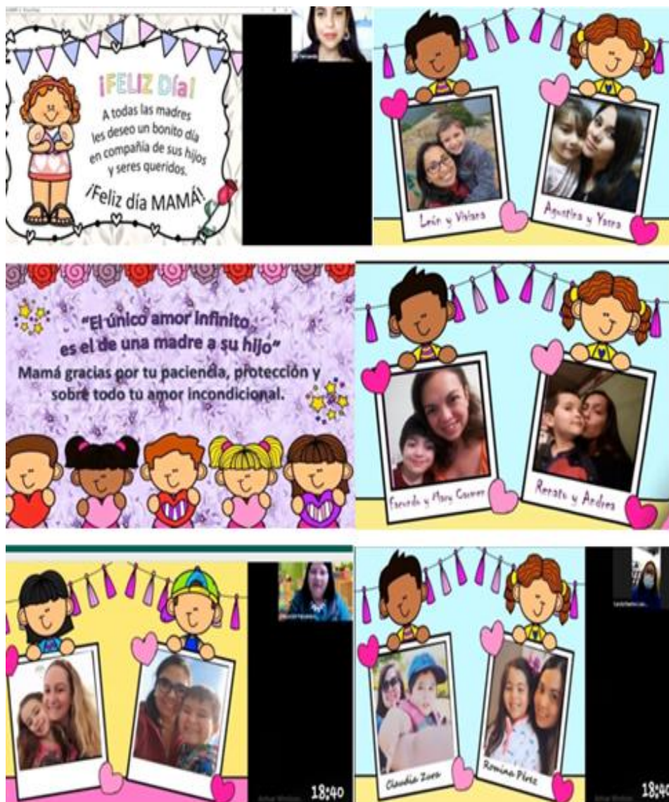
Imágenes de la celebración de ambos cursos