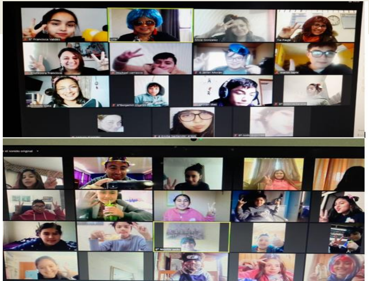
Celebración online "Día del Alumno(a)"

Con todas las medidas sanitarias se realizaron elecciones este fin de semana.