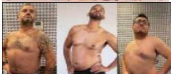
Nos amamos tal cual somos!!!