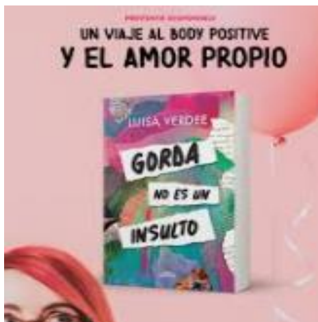
Libro de la Influencer y bloguera Luisa Verdee